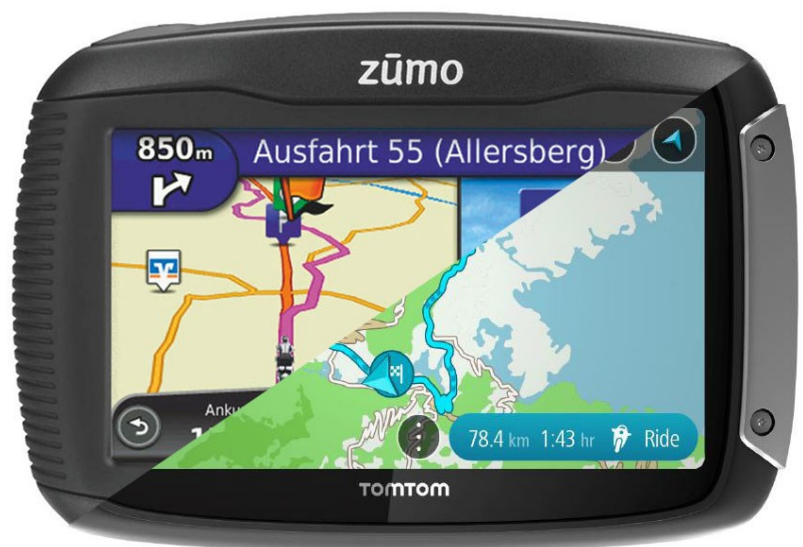
De Zūmo TomTom

Een track wordt in de Zūmo in principe niet herberekend, maar er zit wel een logica in die helpt